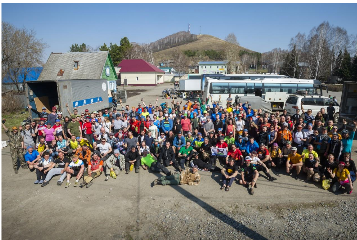
Участники ВЕЛОПЕРВОМАЯ городов: Барнаул, Бийск, Белокуриха, Иркутск, Кемерово, Новокузнецк, Новосибирск, Омск, Томск, Саяногорск, Целинное, Якутск.

Все, что не случается – случается к лучшему! Маршрут пройден, хотя и возникали вопросы к некоторым его деталям. Нынешний Велопервомай больше похож на подготовку отряда спец назначения )) Только в него вступают исключительно добровольцы! Многим понравилось все без исключения! Но лично я бы не хотела повторить все в том же порядке. Зато, я представляю, на что мой организм способен, что я в силах преодолеть и как решить ту или иную проблему, случись нечто подобное. Однозначно, это очень яркое впечатление! И в будущем будет что вспомнить и о чем рассказать!