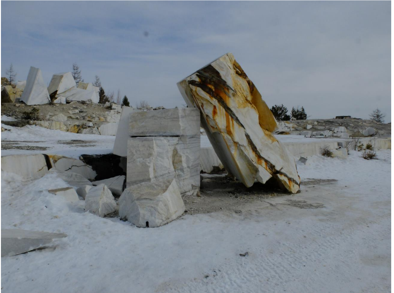
Бугульдейка с высоты мраморного карьера.