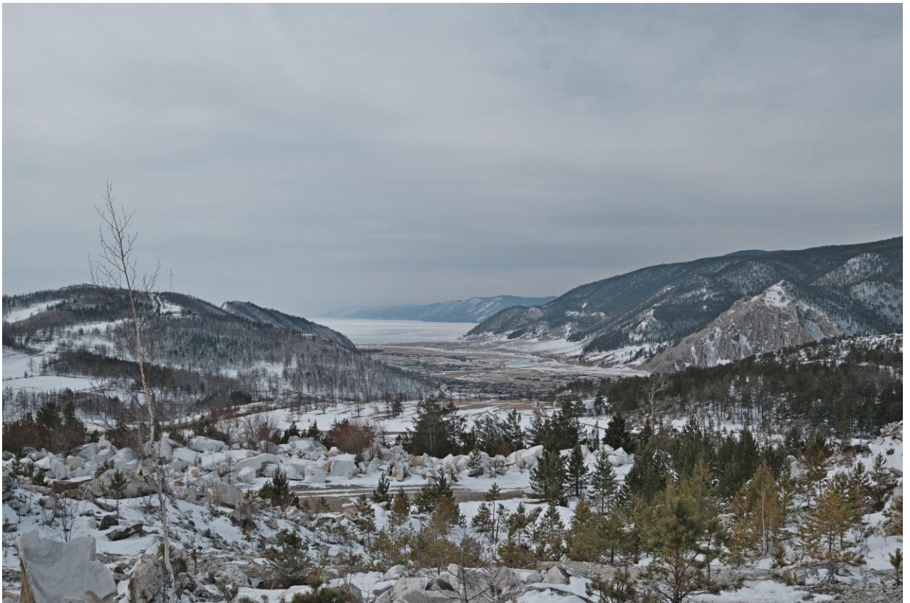
Карьер и мы с небольшой высоты дрона.